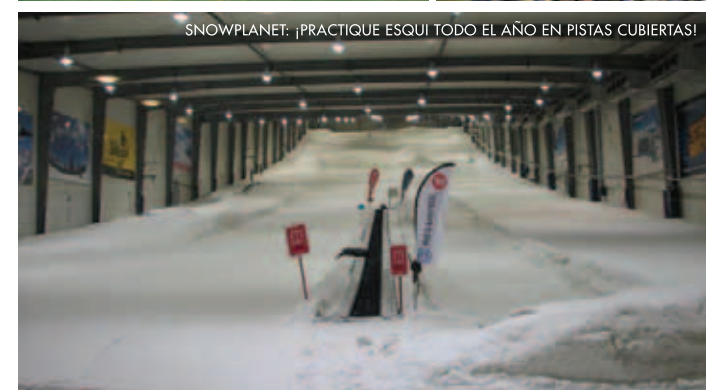
SNOWPLANET: ¡PRACTIQUE ESQUI TODO EL AÑO EN PISTAS CUBIERTAS!