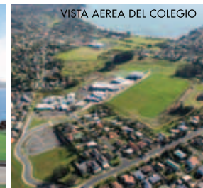
VISTA AEREA DEL COLEGIO