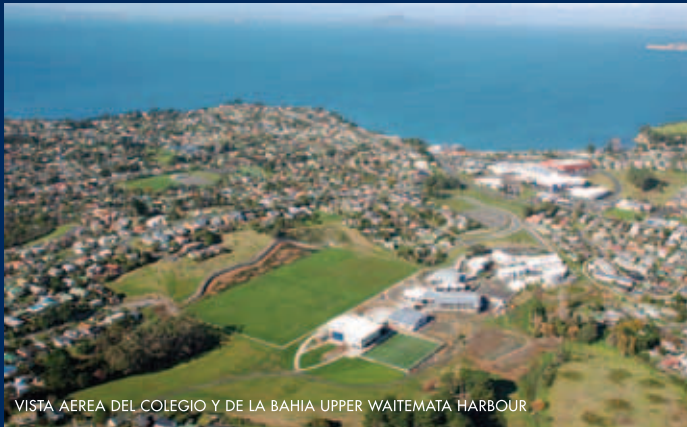
VISTA AEREA DEL COLEGIO Y DE LA BAHIA UPPER WAITEMATA HARBOUR