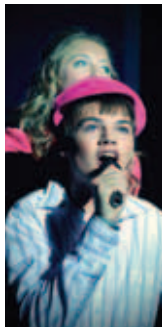
DESDE LA PUESTA EN ESCENA ESCOLAR DE 'HIGH SCHOOL MUSICAL'