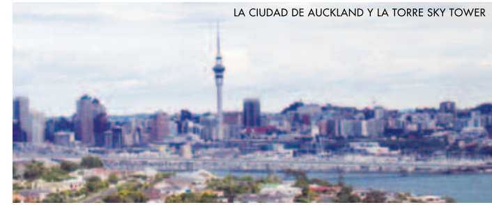
LA CIUDAD DE AUCKLAND Y LA TORRE SKY TOWER