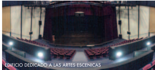
EDIFICIO DEDICADO A LAS ARTES ESCENICAS