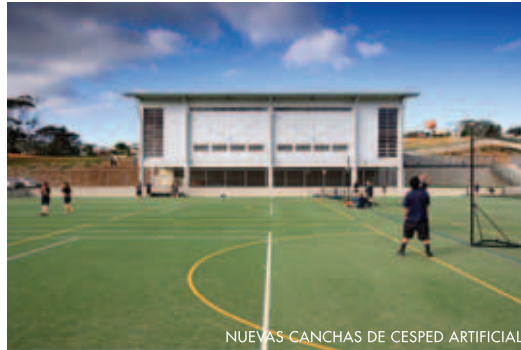
NUEVAS CANCHAS DE CESPED ARTIFICIAL