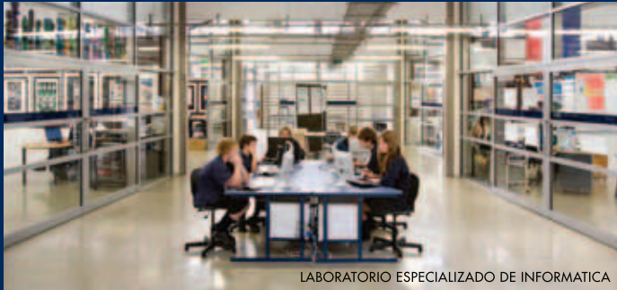
LABORATORIO ESPECIALIZADO DE INFORMÁTICA

WHANGAPARAOA COLLEGE está muy cerca de toda la emoción de Auckland, la ciudad más grande de Nueva Zelanda, pero lo suficientemente lejos como para disfrutar de un estilo de vida seguro en las mejores playas de Nueva Zelanda.