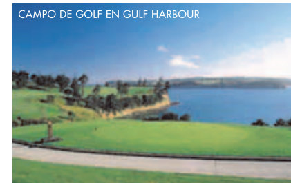
CAMPO DE GOLF EN GULF HARBOUR

WHANGAPARAOA está a aproximadamente 35 minutos al norte de Auckland, la ciudad más grande de Nueva Zelanda.