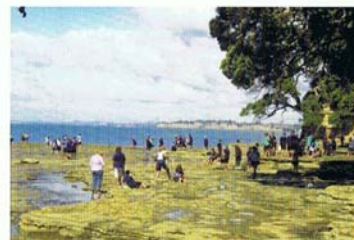
九年級學生們在學校附近的岩石海岸上搜集用于科學和數學課程的資料。