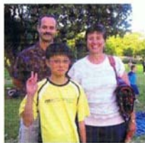
一名國際留學生與他的寄宿家庭合影。