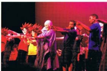
正在進行舞臺選拔賽的芳加帕魯阿中學學生們 — 這是參與眾多戲劇表演活動的機會之一。