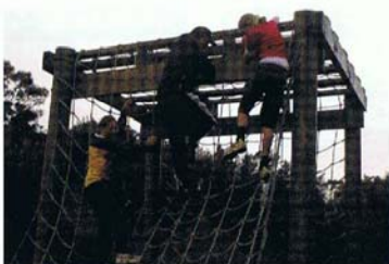
八年級學生們在參與露營活動中的信心課程。