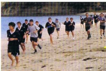
學生們在附近的莎士比亞公園海灘上參加學校舉辦的越野賽跑。