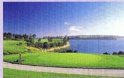
附近的高爾夫海濱鄉村俱樂部高爾夫球場