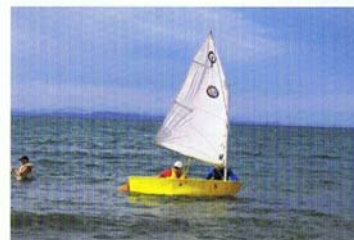
學習駕駛是水上運動的選擇項目之一。