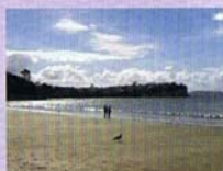
マンリービーチ付近