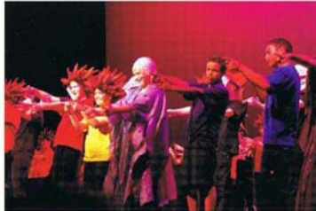
ファンガバラオ・カレッジ生徒による、舞台発表会 — 数ある演劇のひとつです。