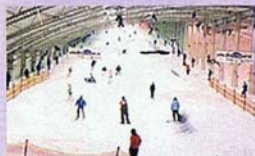
一年中楽しめる室内スキー場！