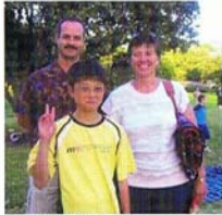
ホームステイ家族と留学生