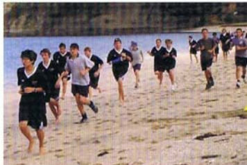
シェイクスピア・パーク・ビーチにおける、学生マラソン大会。