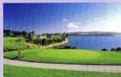
ゴルフ・ハーバー・カントリー・クラブ ・ゴルフコース付近