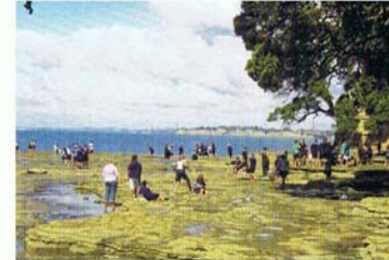
9学年の生徒が、カレッジ近くの岩場の海岸にて、理数クラスの情報収集をする様子。