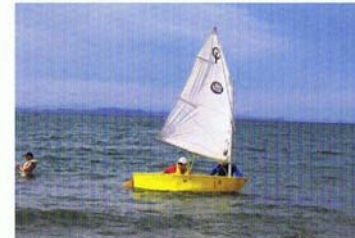
セーリングの授業は、ウォーターワイズ・プログラムの一環。