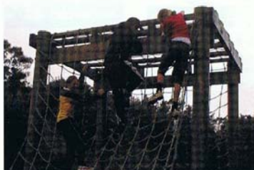
8学年生徒が、自立を目指すキャンプで楽しむ様子。